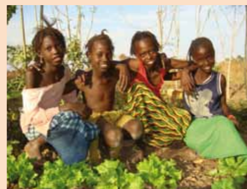
Glada barn i Koussanar

• Organisera en rad barnaktiviteter i byarna för att ge barnen ett eget ställe att där de kan prata och lära sig mer om sina rättigheter. Sammanlagt har fler än 5 000 personer varit inblandade.