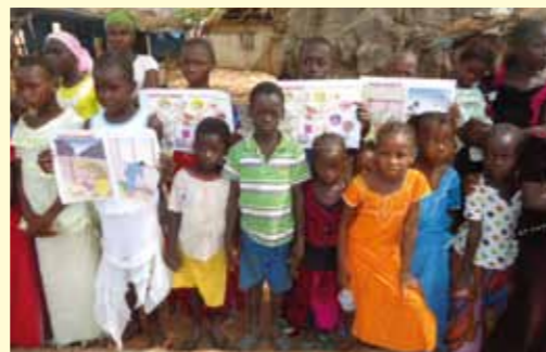
Barn i Koussanar som demonstrerar mot våld mot kvinnor och barn

Barnen i Koussanar och i många andra samhällen firade nyligen barnens dag i Afrika. I Koussanar deltog mer än 500 barn i en parad genom hela byn Koussanar för att uppmärksamma barns rättigheter och fördöma våld mot barn.